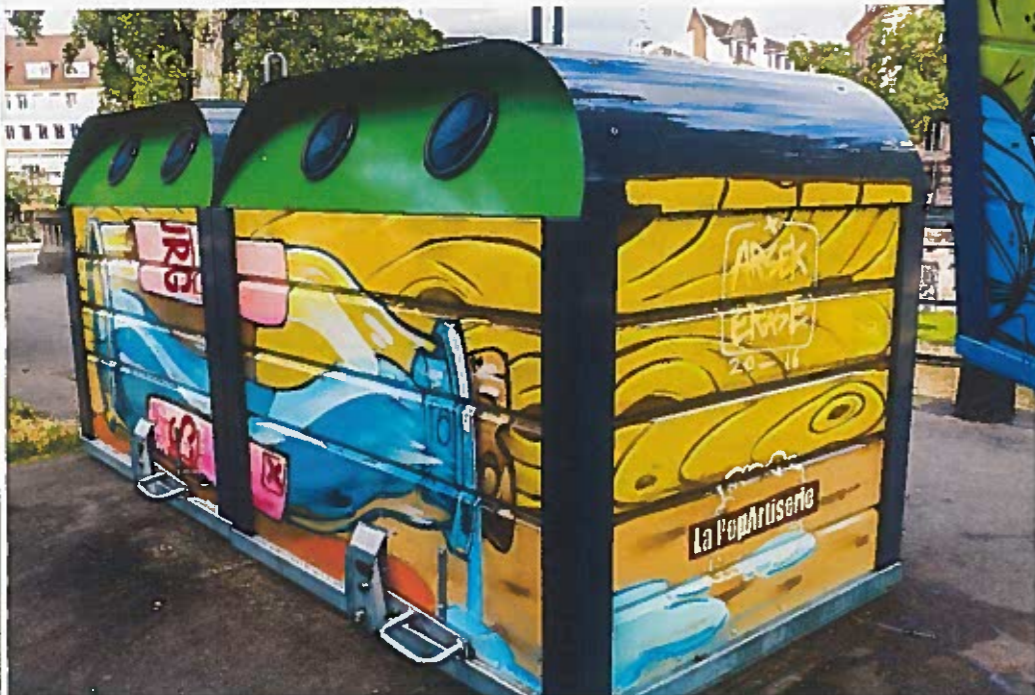
QUAI DU WOERTHEL // Un conteneur à verre peint par Dzia Krank un artiste d'Anvers, en Belgique.