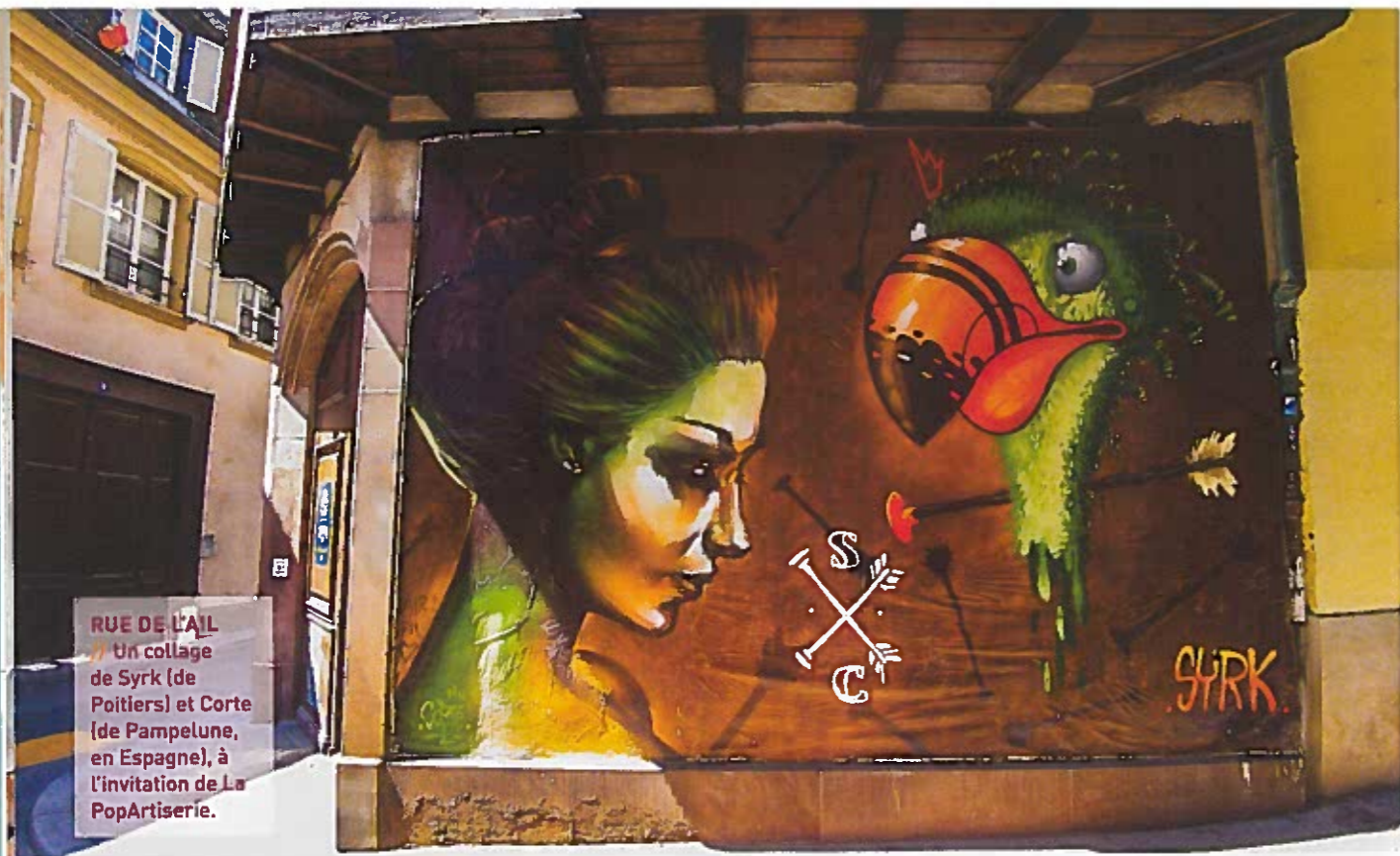
RUE DE L'AIL Un collage de Syrk (de Poitiers) et Corte (de Pampelune, en Espagne), à l'invitation de La PopArtiserie.